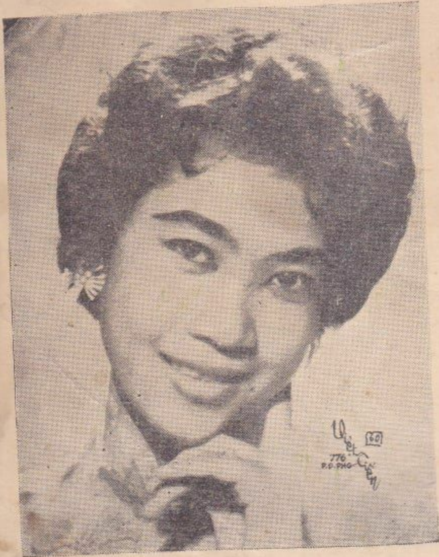
CÔ LỆ - NHI