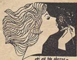
phổ khúc phương -