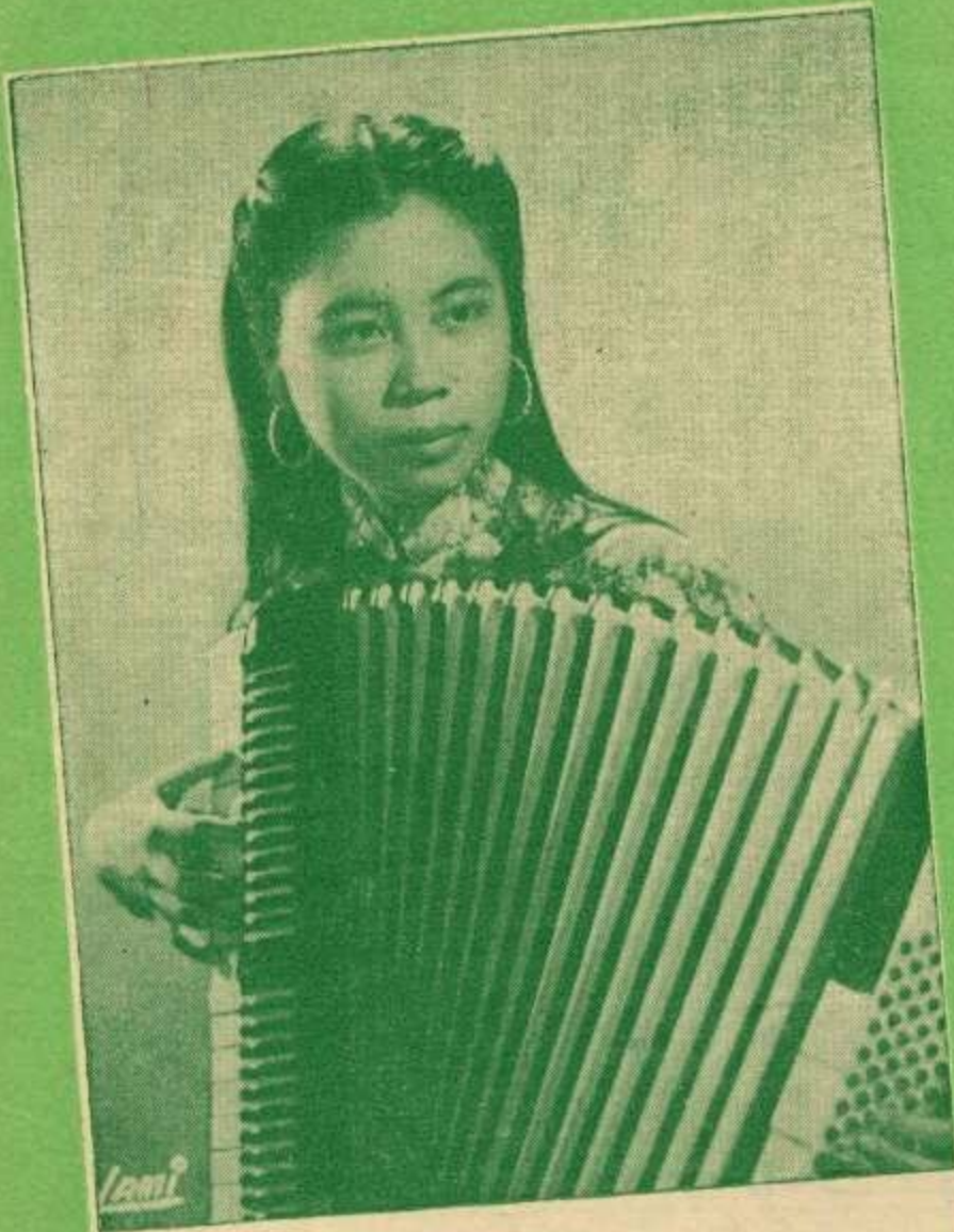
NỮ CA SỸ THÚY-NGA