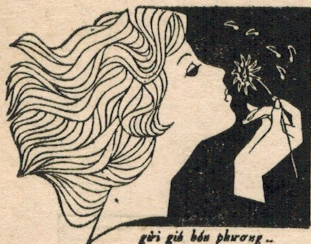
gửi gửi bốn phương...