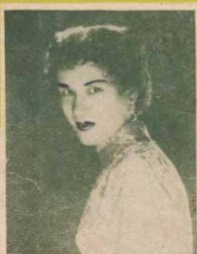
NỮ ĐÀN CA MINH - TRĂNG