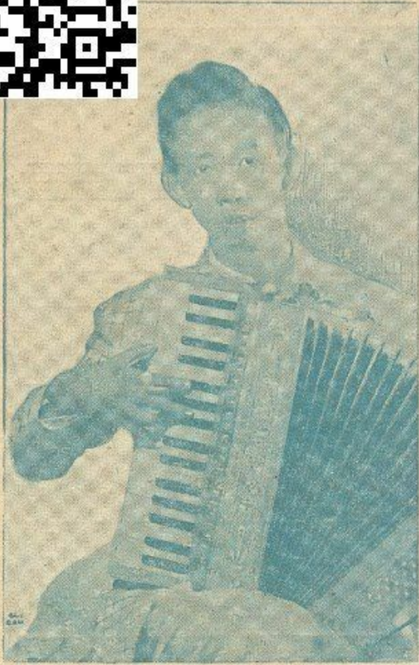
sống lại một đời người - ngẩn-ngùi vì Nghệ-thuật và Tự-Do: nhạc-sĩ La-Hối

Sinh năm 1920. Chết năm 1945. Hai mươi lăm năm: một cuộc đời. Cuộc đời ngắn ngủi của một nhạc-sĩ và cũng là một liệt-sĩ đầy nhiệt-huyết: LA-HỐI.